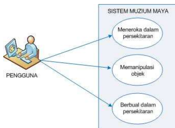
RAJAH 1. Gaya interaksi pengguna dengan persekitaran muzium maya

Kajian ini memodel analisis tugas mengguna use case . Tujuan pemodelan ini adalah memvisual proses interaksi pengguna dengan persekitaran muzium maya. Rajah 1 menjabar aksi pengguna dan tanggungjawab sistem apabila berlaku interaksi di antara pengguna dan sistem. Terdapat tiga jenis interaksi iaitu penerokaan, manipulasi dan berbual.