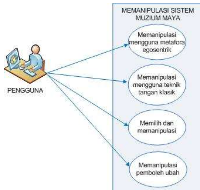
RAJAH 3. Gaya interaksi manipulasi dalam persekitaran muzium maya

Rajah 3 menunjuk aksi pengguna dengan sistem bagi manipulasi artifak yang mengaplikasi empat teknik; metafora egosentrik, tangan maya klasik, memilih dan memanipulasi, dan manipulasi pemboleh ubah.