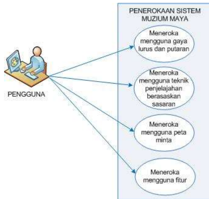
RAJAH 2. Gaya interaksi penerokaan dalam persekitaran muzium maya

Rajah 2 menggambar aksi pengguna dengan sistem terhadap penerokaan dalam persekitaran yang melibatkan empat gaya penerokaan; gaya lurus dan putaran, teknik penjelajahan berasaskan sasaran, penggunaan peta minda dan fitur.