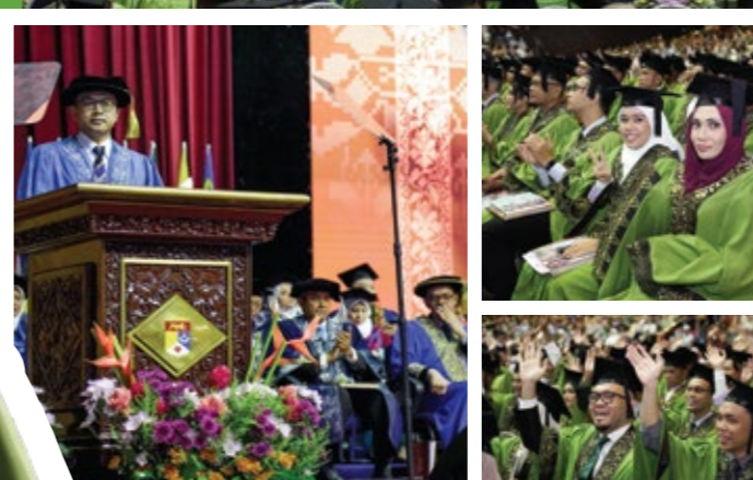
Ucapan Naib Canselor