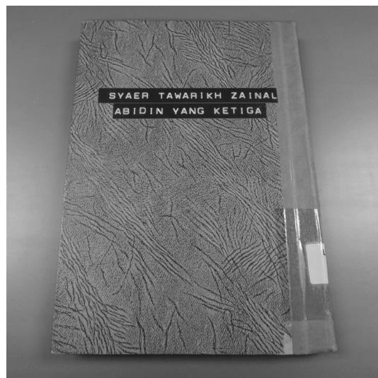
FOTO 4. Naskah Syair Tawarikh Zainal Abidin Yang Ketiga yang tersimpan di Muzium Negeri Terengganu