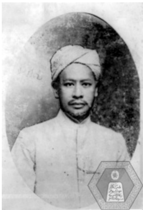
FOTO 1. Sultan Zainal Abidin III (1881-1918)

hasil persuratan Terengganu abad ke-19 tersebut akhirnya membawa kepada penemuan-penemuan penting tentang keperibadian Sultan Zainal Abidin III sebagai seorang model pemerintah yang sangat memelihara budaya hidup masyarakat Melayu sama ada dari sudut budaya material mahupun budaya pemikiran dan intelektualnya.