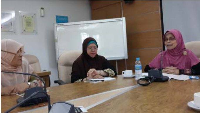
Majlis Penyerahan Tugas Yang DiPertua SUKMANITA

SUKMANITA ingin mengucapkan selamat menunaikan ibadat haji kepada bakal haji. Semoga mendapat haji yang mabrur.