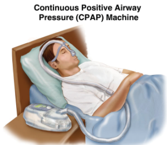
Continuous Positive Airway Pressure (CPAP) Machine