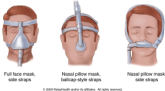
Full face mask, side straps