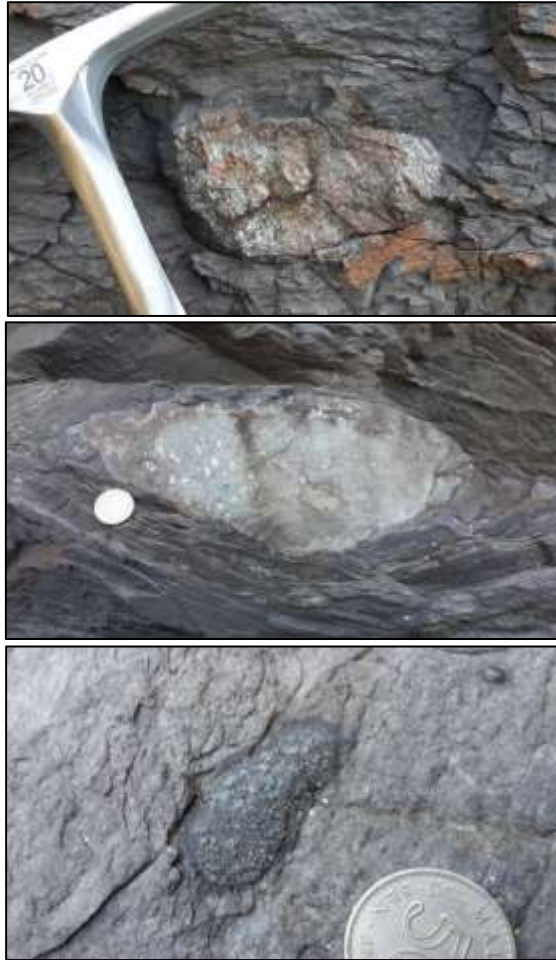
Berbagai jenis dropstone boleh ditemui di Tanjung Mali, antaranya ialah klas jenis granit (gambar atas), batu kapur (tengah) dan batu kuarzit (bawah), memberi gambaran bahawa punca dropstone ini datang dari kawasan yang berbeza.

Kehadiran sesar di kawasan ini telah mengubah orientasi batuan di sini. Sesar yang paling jelas dilihat di kawasan ini ialah sesar mendatar ke kanan yang berarah hampir timur-barat. Struktur kekar yang tersingkap di kawasan ini kebanyakan telah diisi dengan kuarza dan membentuk telerang kuarza.