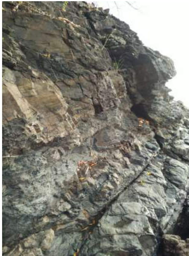
Singkapan batu lumpur yang dominan di Tanjung Mali. Dalam batu lumpur ini menyimpan banyak bukti-bukti sejarah geologi yang telah dialami oleh Langkawi, Malaysia dan Asia Tenggara.

Batu jatuh ( dropstone ) boleh dijumpai dalam lapisan lumpur. Batuan jenis ini juga dinelani sebagai batu lumpur berpebel atau lebih khususnya dalam istilah geologi dipanggil diamiktit. Secara umumnya sedimen halus seperti lumpur hanya terbentuk di kawasan tenang dan kawasan tenang tidak boleh ada sedimen butiran kasar. Salah satu cara sedimen kasar boleh berada terkandung dalam lumpur ialah dengan cara diangkut oleh air batu atau glasier yang terapong di permukaan air. Apabila glasier cair disebabkan cuaca panas, segala sedimen yang ada dalam glasier akan dilepaskan dan jatuh ke dasar lautan yang berlumpur.