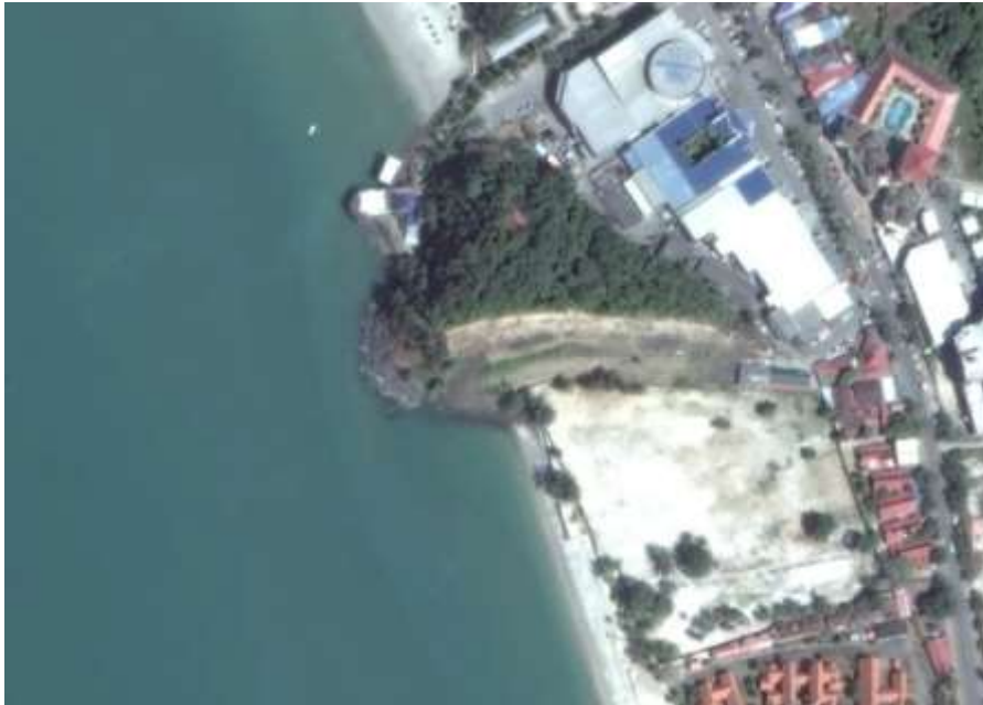
Bukit Tanjung Mali sudah dipotong untuk pembangunan hotel. Bukit Tanjung Mali boleh dijadikan tempat tarikan untuk penghuni hotel dan pelancong di sekitar Pantai Chenang dan Pantai Tengah.