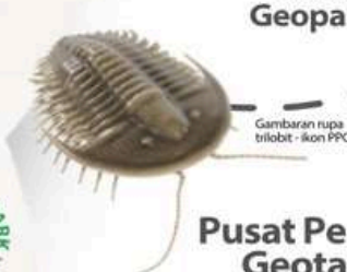
Gambaran rupa trilobit - ikon PPG

Sains Kelestarian untuk Pembangunan Geopark