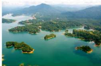
▲ Tasik Kenyir, Kenyir Geopark, Terengganu