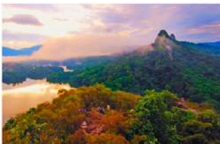
▲ Geotapak Permatang Kuarza Gombak, Gombak-Hulu Langat Geopark