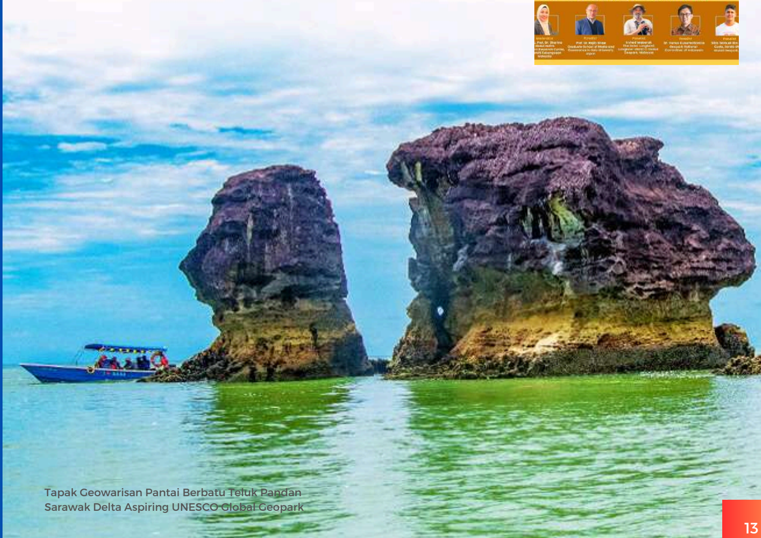
Tapak Geowarisan Pantai Berbatu Teluk Pandan Sarawak Delta Aspiring UNESCO Global Geopark