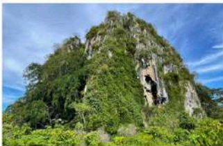
▲ Geotapak Jujukan Perm-Trias Gua Bama, Lipis Geopark, Pahang