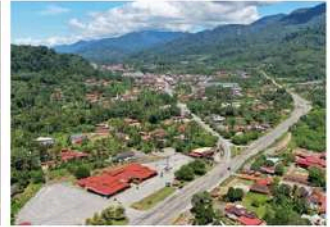
▲ Dataran aluvium Sungai Perak, Lenggong Geopark, Perak