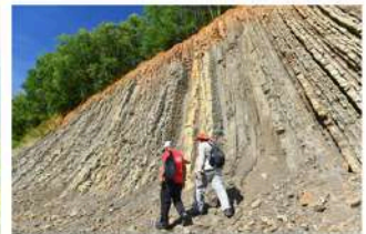
▲ Geotapak Enapan Lautan Dalam, Kg. Bebuloh Darat, Labuan Geopark