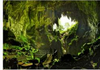
▲ Wind Cave, Sarawak Delta aspiring UNESCO Global Geopark