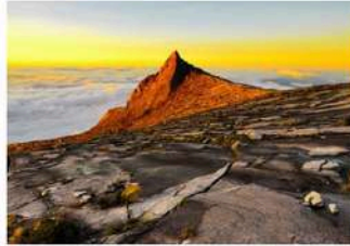
▲ Gunung Kinabalu, Kinabalu UNESCO Global Geopark