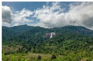
▲ Air terjun Jemaluang, Stong Geopark, Kelantan