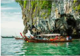
▲ Muara Sungai Kilim, Langkawi UNESCO Global Geopark