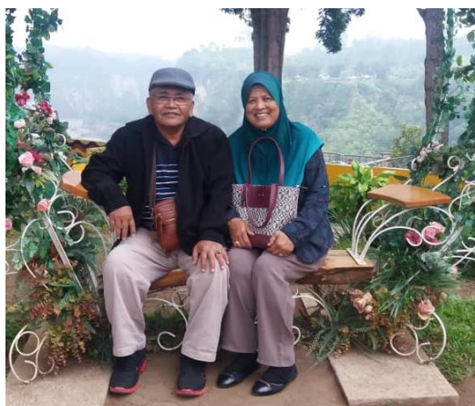
← Bersama isteri tersayang