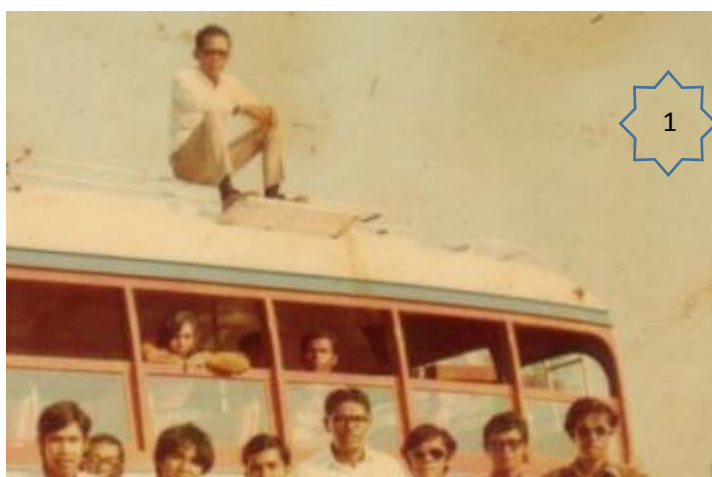
Di atas bas pertama UKM BY 30. Besama kakitangan rombongan ke Pantai Morib 1972

Keramahan beliau menjadikan keakraban beliau dengan rakan setugas dan pelajar tetap utuh dan berterusan hingga ke hari ini.