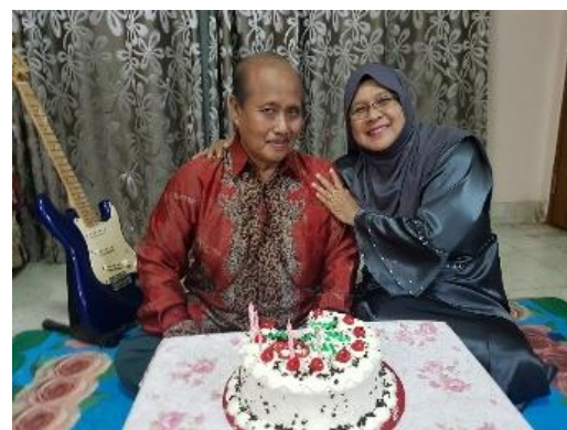
Gambar sekarang, bersama rakan-rakan dan isteri tersayang.