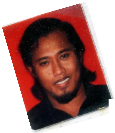
Gambar-gambar semasa lapor diri dan mula bertugas