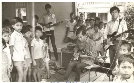
Bersama dengan gitar kesayangan